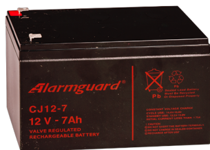
Bezúdržbový zálohovací akumulátor 12 V/7 Ah.