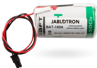
Baterie určená pro napájení plně bezdrátové venkovní sirény JA-163A.